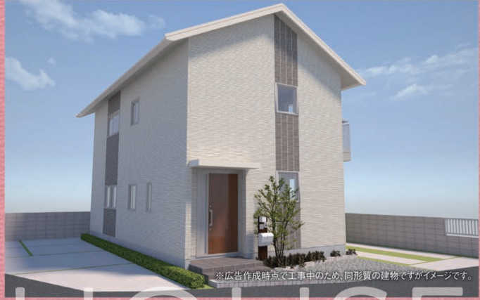
※広告作成時点で工事中のため、同形質の建物ですがイメージです。