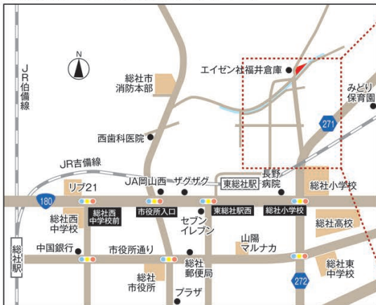
※広告作成時点で工事中のため、同形質の建物ですがイメージです。