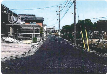
現地写真(西側から)