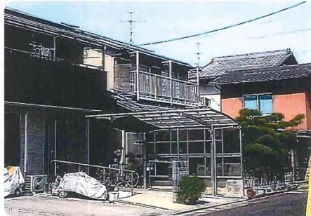
現地写真(南西側から)