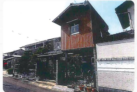
現地写真(南東側から)